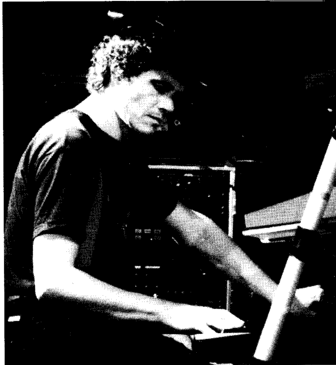
Brain . . .