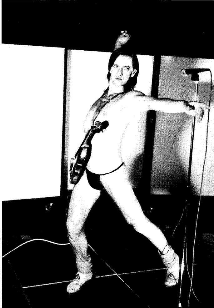
... & Body