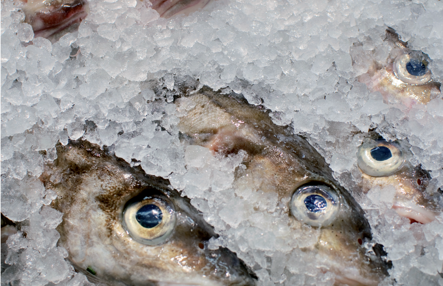
Dramatischer Wandel in den Weltmeeren durch Artensterben: Auch Überfischung trägt dazu bei. Dramatic changes brought about by species loss in the oceans: Overfishing also contributes to the problem.

In contrast to traditional biodiversity research, microbiological research has long since taken these interrelated factors into account, because here the concept of species plays only a secondary role. In microbiology, the diversity of microorganisms is for the most part understood as a diversity of processes. For instance, in anaerobic – or oxygenfree – zones of the oceans diversity depends on the chemical bonds available to bacteria for energy production. And the products of these metabolic processes provide the energy base for other microorganisms, and in turn determine their diversity.