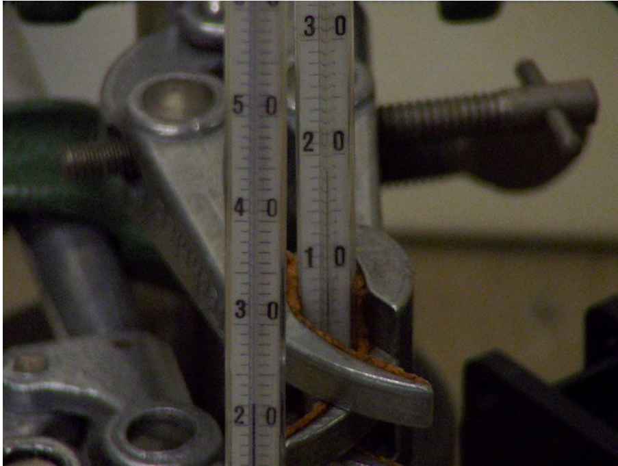
Abb. 2: Der Messkopf des rechten Thermometers ist mit feuchter Watte umwickelt und daher kälter.