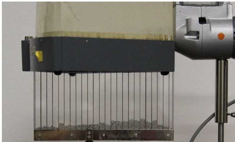
Abb. 3: mögliches Messergebnis.