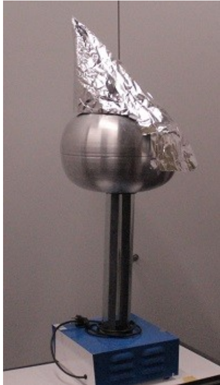
Abb.2: Van de Graaf Generator mit großer, konischer Spitze.