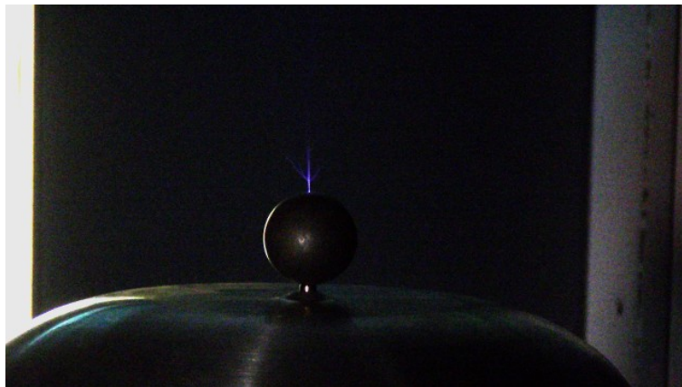
Abb. 3: Kugel mit 30 mm Durchmesser aufgelegt.

Sollte keine Entladung sichtbar werden, ist die Spannung nicht groß genug, die Ladungen fließen definiert zu schnell ab. In diesem Fall können Kugeln mit kleiner werdenden Durchmessern aufgelegt werden. Dann werden auf jeden Fall Entladungen sichtbar, da die Spannung größer werden kann.