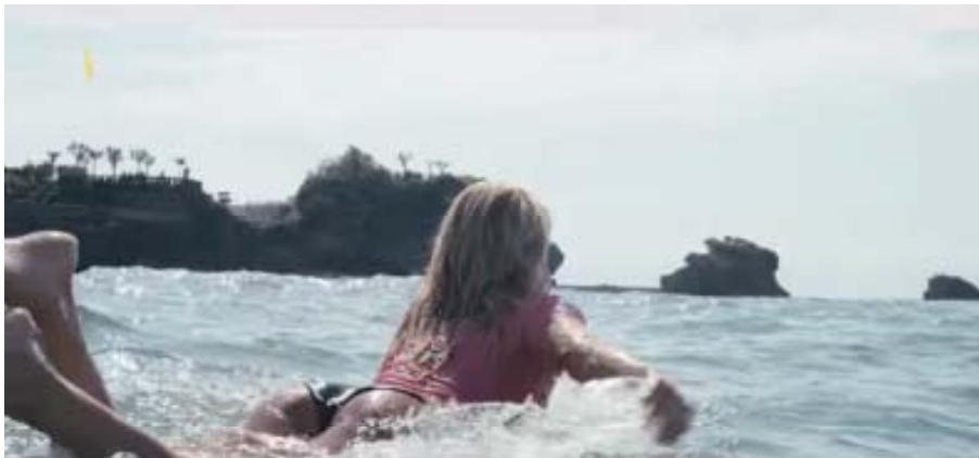
Abb. 2: Auf dem Surfbrett (Minute 1.33)