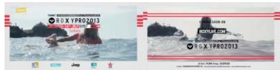
Abb. 6: Einblendung der Schriftzeichen (Minute 1.37 und 1.42)

eingeblendet wird, wird der Eindruck vermittelt, jemandem beim Schreiben zuzusehen, und somit der Blick auf die Schrift gelenkt. Die Schriftzeichen „women’s world surfing championship“ und „ROXY PRO2013“ sind dadurch im Fokus der letzten beiden Einstellungen des Teasers. Außerdem betont die rote Unterlegung der Zeichen das Datum des Contests und die roten Balken rahmen die Schrift in der letzten Einstellung, die darüber hinaus durch das Ausgrauen des darunterliegenden Bildes der Surferin betont wird (vgl. Abb. 6). Es werden in dem Teaser, mit McRobbies Worten, „Aufmerksamkeitsräume“ (2010, S. 88) eröffnet, die sich auch auf den Contest und somit auf den professionellen Frauen-Surfsport übertragen. Auch wenn die Inszenierung des Surferinnenkörpers und die Bewerbung des ‚Surflifestyles‘ die Darstellung des professionellen Frauen-Surfsports zu überschatten scheinen, so ist der Sport dennoch Teil des Teasers und somit Teil des Sichtbaren.