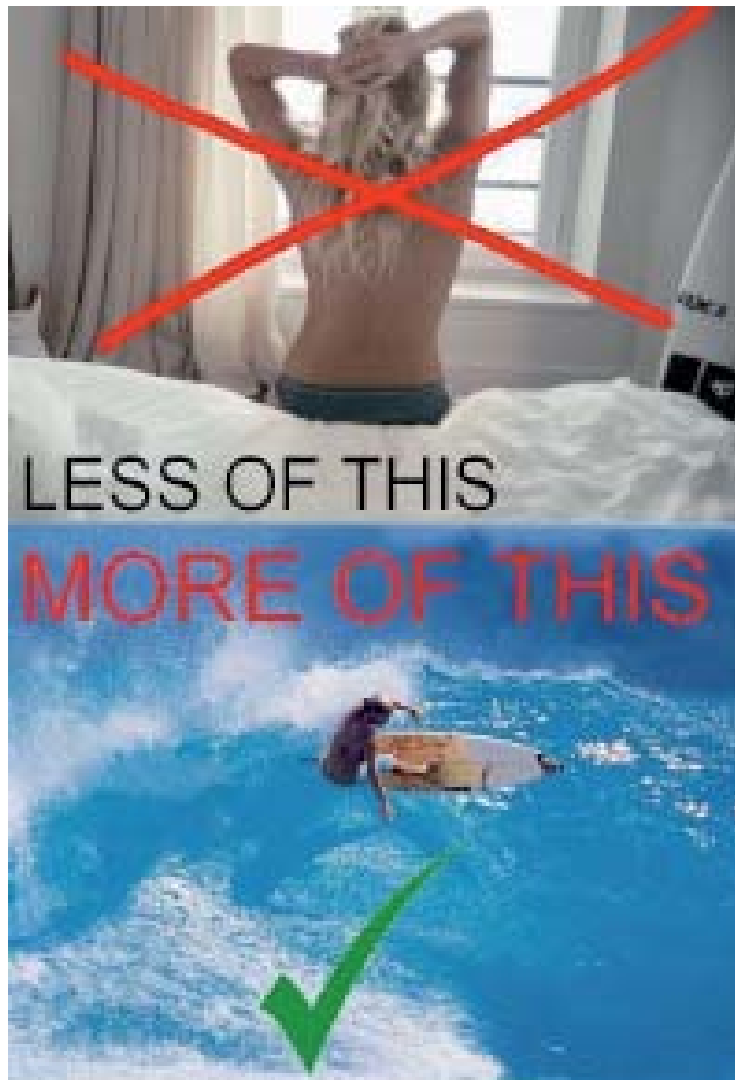
Abb. 7: Profilbild der Facebook-Gruppe