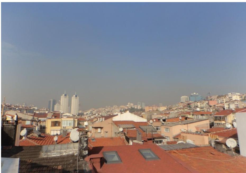
(Blick von unserer Dachterrasse)

Mein Wintersemester in Istanbul zu absolvieren, habe ich ziemlich kurzfristig entschieden, denn der eigentlich bereits vergebene Austauschplatz wurde erneut ausgeschrieben. Somit habe ich mich im Frühling 2014 bei der Beykent Üniversitesi in der Türkei beworben und nach einiger Zeit eine positive Rückmeldung erhalten. Zu den Bewerbungsunterlagen gehörten unter anderem Bilder, Lebenslauf, Motivations schreiben, aktuelle Notenbescheinigung, vorläufiges Learning Agreement usw. Das Vorbereiten der Unterlagen für die Bewerbung nimmt ein wenig Zeit in Anspruch ist aber keine Hürde. Nachdem ich die Zusage zum Wintersemester erhalten hatte, kümmerte ich mich um allgemeine Dinge wie das Beantragen einer Kreditkarte (ich habe mich für die Deutsche Kreditbank entschieden, welche ich aufgrund der kostenlosen Abhebung empfehlen kann) und dem Abschließen einer Auslandsversicherung. Meine eigene Krankenversicherung hat mir auf Anfrage das T/A 11 Formular zugesandt, was für die Beantragung des Residence Permits in der Türkei erforderlich ist. Eine weitere Krankenversicherung sowie Haftpflichtversicherung habe ich dennoch abgeschlossen, weil viele Versicherungen nur über einen kurzen Zeitraum außerhalb der EU haften. Außerdem habe ich mich vorab um ein Zimmer gekümmert und habe potenzielle Wohngemeinschaften angeschrieben sowie Verabredungen via Skype unternommen. Dabei habe ich meine tolle WG über Craigslist Istanbul gefunden.