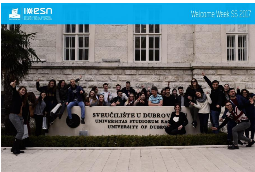
Erster Uni-Tag mit Gruppenfoto der ERASMUS-Studenten

Direktflüge gab es zu Beginn meines Semesters leider nicht und grundsätzlich sollte man auch in der Flughafen-Wahl etwas offener sein, wenn man nicht unbedingt 18-24 Stunden unterwegs sein möchte. Ich bin am 05. Februar von Köln über Zagreb nach Dubrovnik geflogen. Zwar hatte ich in Zagreb 3 Stunden Aufenthalt, aber dafür nur 130€ für den gesamten Flug bezahlt mit Gepäck. Bei Ankunft ging es mit dem Shuttle-Bus von Atlas für 40kn (ca. 6€) ins Zentrum von Dubrovnik. Von dort habe ich einen Bus genommen. Je nachdem wo das Apartment in der Stadt ist, fahren 4 verschiedene Buslinien regelmäßig bis ca. 22 Uhr abends.