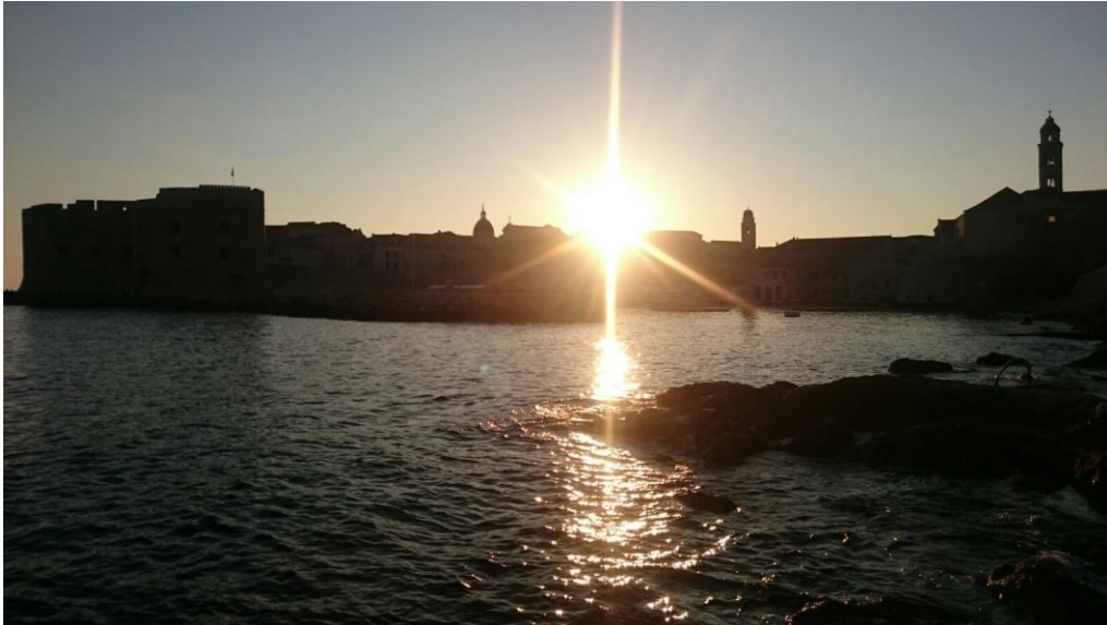
Sonnenuntergang über der Altstadt

Ich kann Dubrovnik für jeden Studenten als ERASMUS-Austausch nur wärmstens empfehlen. Die Stadt ist wunderschön und mindestens die Hälfte deiner ERASMUS-Zeit auch nicht überlaufen, sodass du wirklich in Ruhe alles erkunden kannst. Die Betreuung vor Ort durch ESN und das International Office Dubrovnik ist einwandfrei gelaufen und war wirklich top. Wer nicht unbedingt die Großstadt braucht und es gerne ein paar Grad wärmer hat, der wird hier sehr glücklich werden. Durch die Größe der Uni ist auch die Gruppe der ERASMUS-Studenten noch überschaubar und familiär geprägt. Ich hatte hier eine super Zeit, die ich definitiv nicht missen möchte 😊