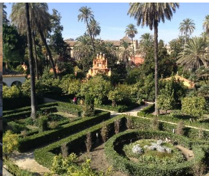
Inerhalb der Alcazar