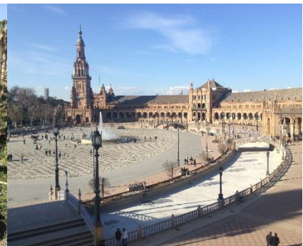
Plaza de España