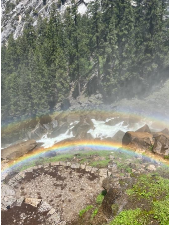
Doppel-Regenbogen im Yosemite