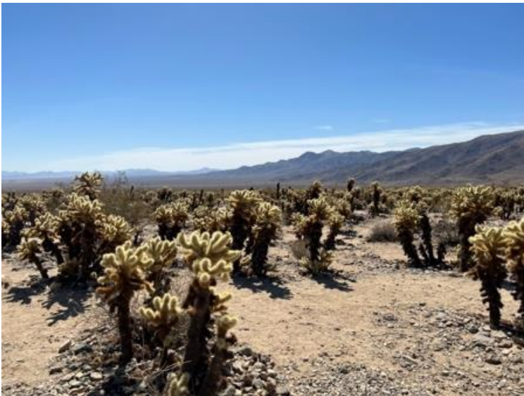
Joshua Tree National Park