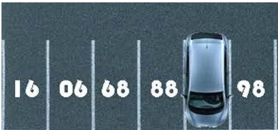
Abbildung 1: Denkmuster und Querdenken