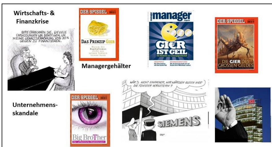
Abb. 1.4: Wieso ist das Thema der Unternehmensverantwortung so gefragt?

Enron und Arthur Anderson sind zu Schlüsselwörtern geworden für Ausprägungen unternehmenspolitischen Handelns, die von der Gesellschaft nicht länger akzeptiert werden. Betriebsrätekorruption bei der Volkswagen AG und die Affären bei Infineon und Siemens haben in der Folge gezeigt, wie auch deutsche Unternehmen in den Sog solcher Verhaltensweisen geraten sind. Weitere Fälle betreffen die Kommunikation zahlreicher Konzernmanager während der letzten Jahre internationaler Finanz- und Wirtschaftskrise, ihr für große Teile der Bevölkerung unverständliches Beharren auf vertraglich festgelegten Bonuszahlungen trotz offenkundigen Managementversagens sowie illegales Ausspionieren von Mitarbeitern (Lidl, Telekom, Deutsche Bahn). Das verbreitete Gefühl, dass diese Entwicklungen in den frühindustrialisierten Wirtschaftsgesellschaften das Vertrauen der Menschen in die Moral der Manager und damit auch erwerbswirtschaftlicher Unternehmen als Organisationen auf einen historischen Tiefpunkt haben sinken lassen, ist mittlerweile auch empirisch belegt worden (vgl. Bertelsmann Stiftung 2009).