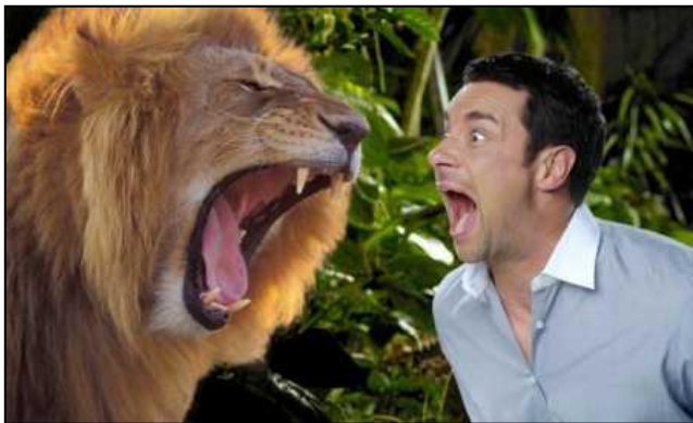
Abb.: 1.3 gradueller Unterschied zwischen Mensch und Tier.