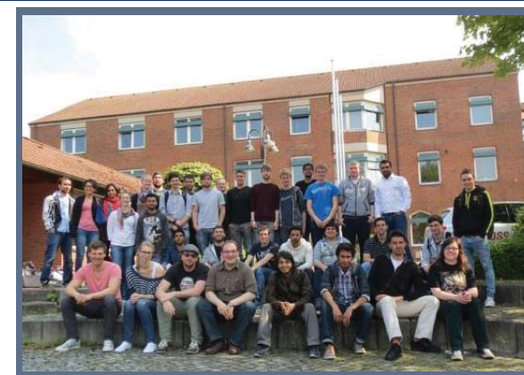
Engineering Physics Students of 2013 during basic laboratory course

Liebe Alumni, Studierende und Freunde des Engineering Physics Studiengangs,