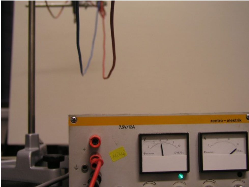
Abb. 1: Sich abstoßende Messleitungen