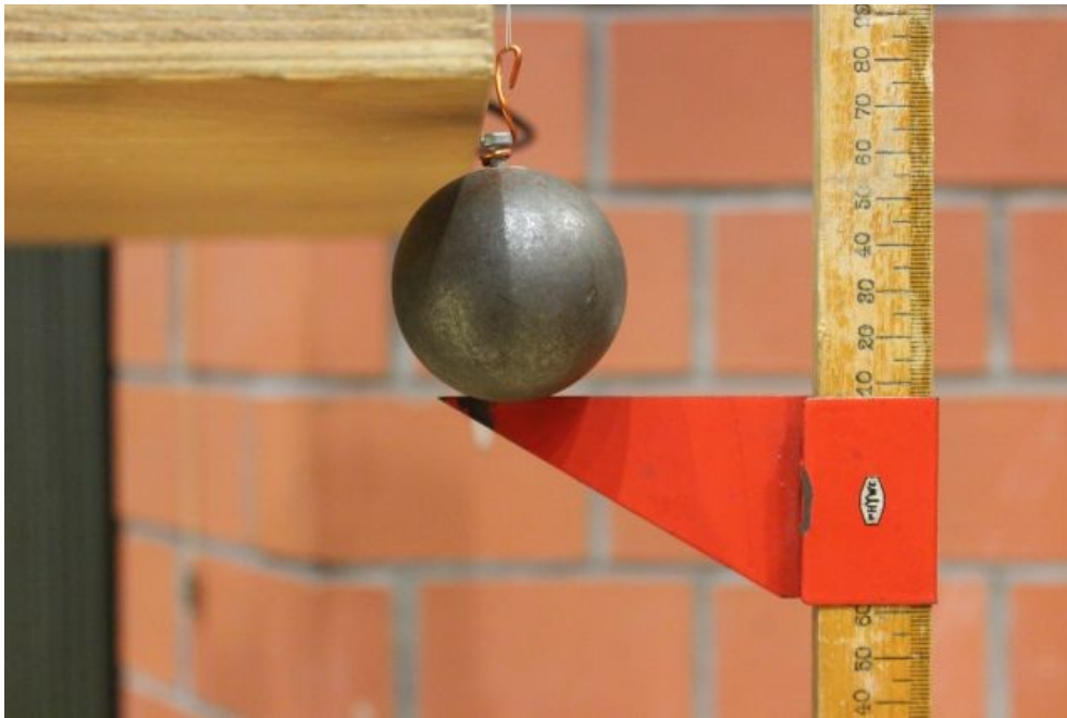
Nachweis der Längenänderung