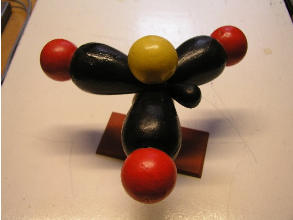
Abb. 4: Methyl