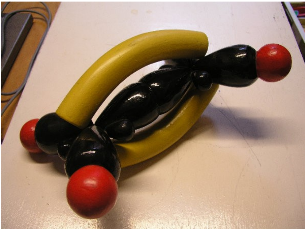
Abb. 3: Ethyl