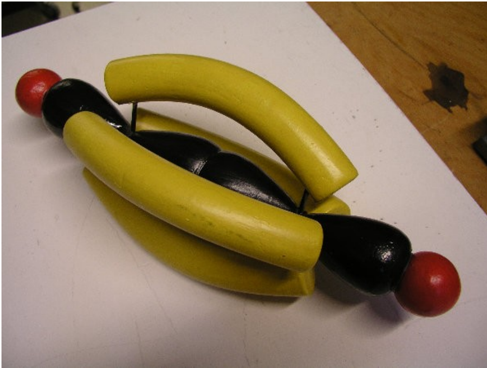
Abb. 1: Molekülmodell