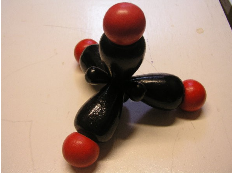
Abb. 2: Methan