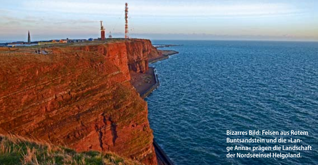
Bizarres Bild: Felsen aus Rotem Buntsandstein und die »Lange Anna« prägen die Landschaft der Nordseeinsel Helgoland.