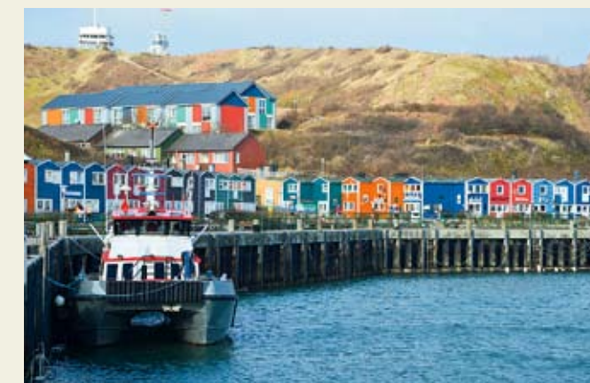
Ein Hoch im Norden: Selbst in der kalten Jahreszeit herrscht auf der Insel Helgoland dank des Golfstroms das mildeste Klima Deutschlands.

► Weitere Infos: Auf der Website www.helgoland.de findet man Unterkunfts- und Gastronomie-tipps in allen Kategorien sowie viel Wissenswertes zu »Deät Lun«.