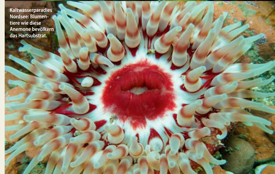
Kaltwasserparadies Nordsee: Blumentiere wie diese Anemone bevölkern das Hartsubstrat.