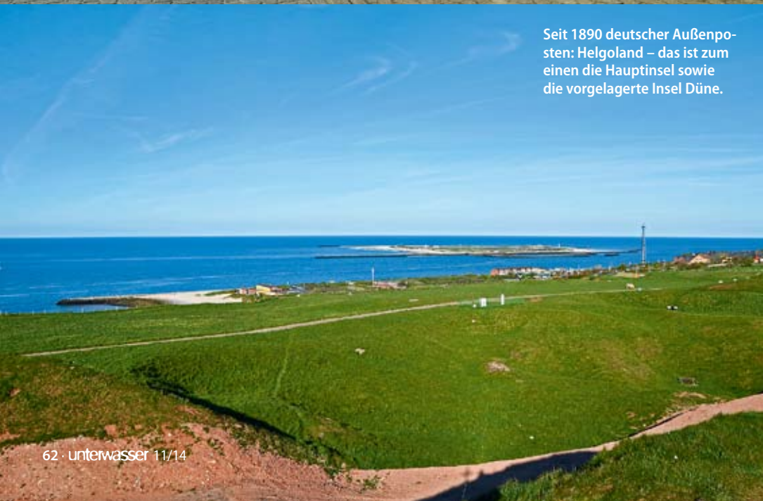
Seit 1890 deutscher Außenposten: Helgoland – das ist zum einen die Hauptinsel sowie die vorgelagerte Insel Düne.

Es ist früher Mittag, als die Fähre uns und unsere gefühlten hundert Gepäckstücke auf dem »Roten Felsen« entlässt, der sich mitten im Nirgendwo aus dem Meer erhebt. Tagestouristen schwanken schon leicht angetrunken an uns vorbei und taumeln in den nächsten Duty-Free-Laden. Andere hetzen, die Kamera, das iPad oder das Handy erhoben, an den Hummerbuden vorbei, um ja alles in den drei Stunden Aufenthalt zu dokumentieren. Doch wir haben Zeit, sagen wir uns immer wieder, und versuchen, uns mit unserem Berg an Gepäck nicht von der Eile der anderen mitreißen zu lassen. Die kommenden drei Monate werden wir genug Zeit für alles hier auf Helgoland haben.