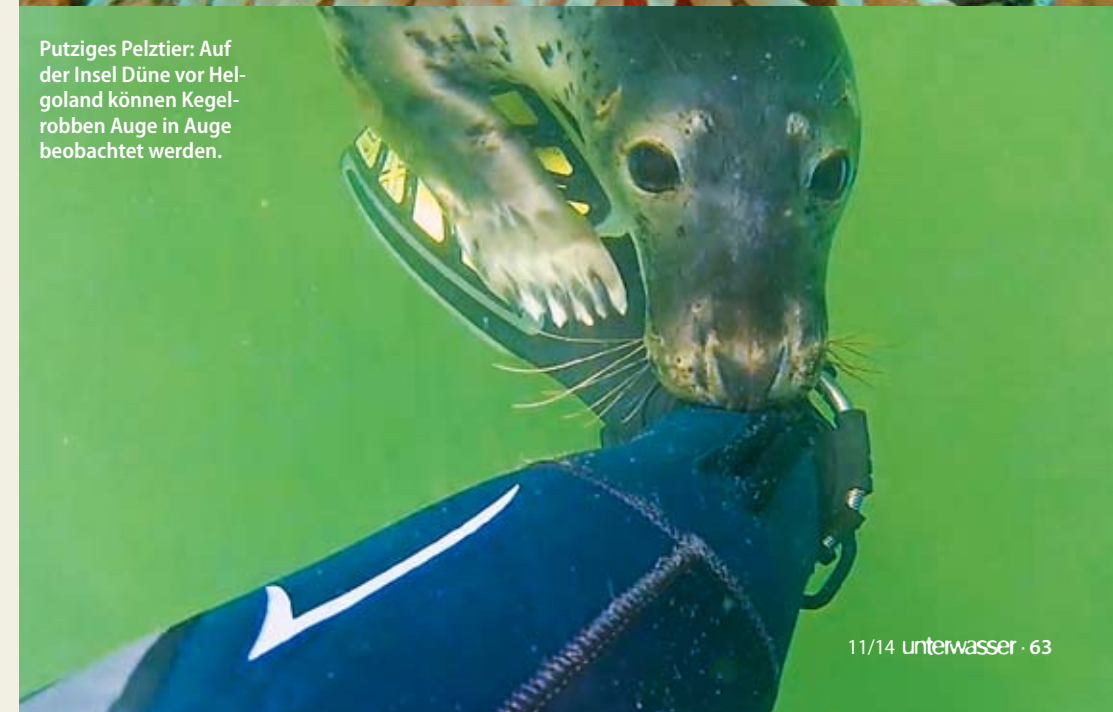
Putziges Pelztier: Auf der Insel Düne vor Helgoland können Kegelrobben Auge in Auge beobachtet werden.