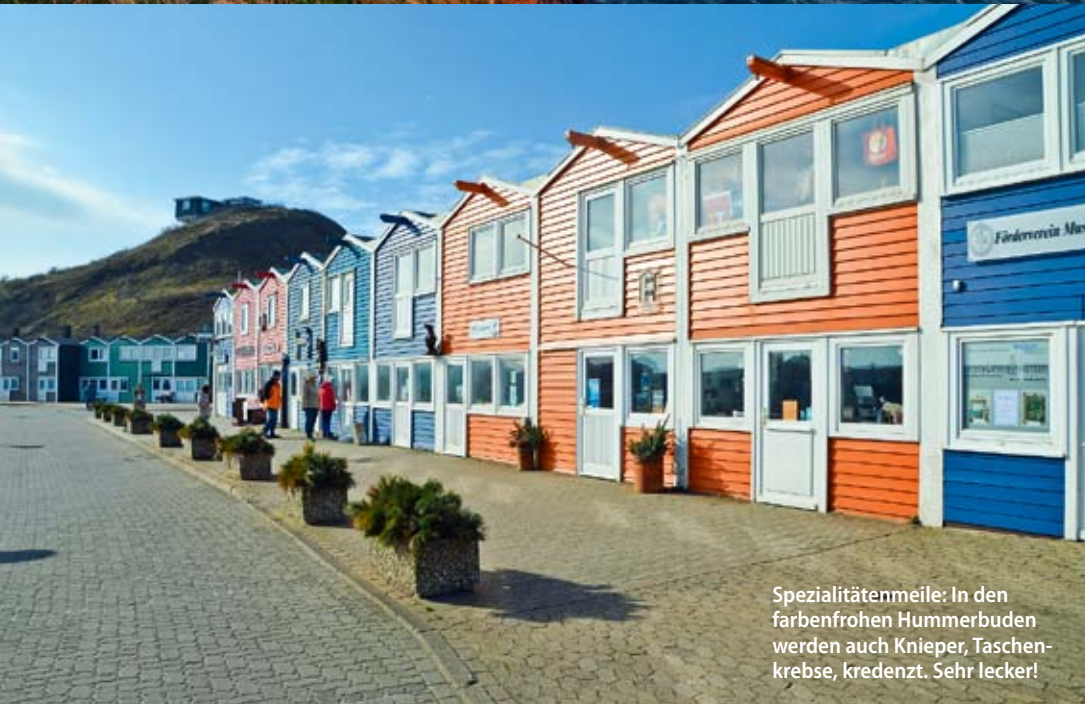
Spezialitätenmeile: In den farbenfrohen Hummerbuden werden auch Knieper, Taschenkrebse, Kredenzt. Sehr lecker!