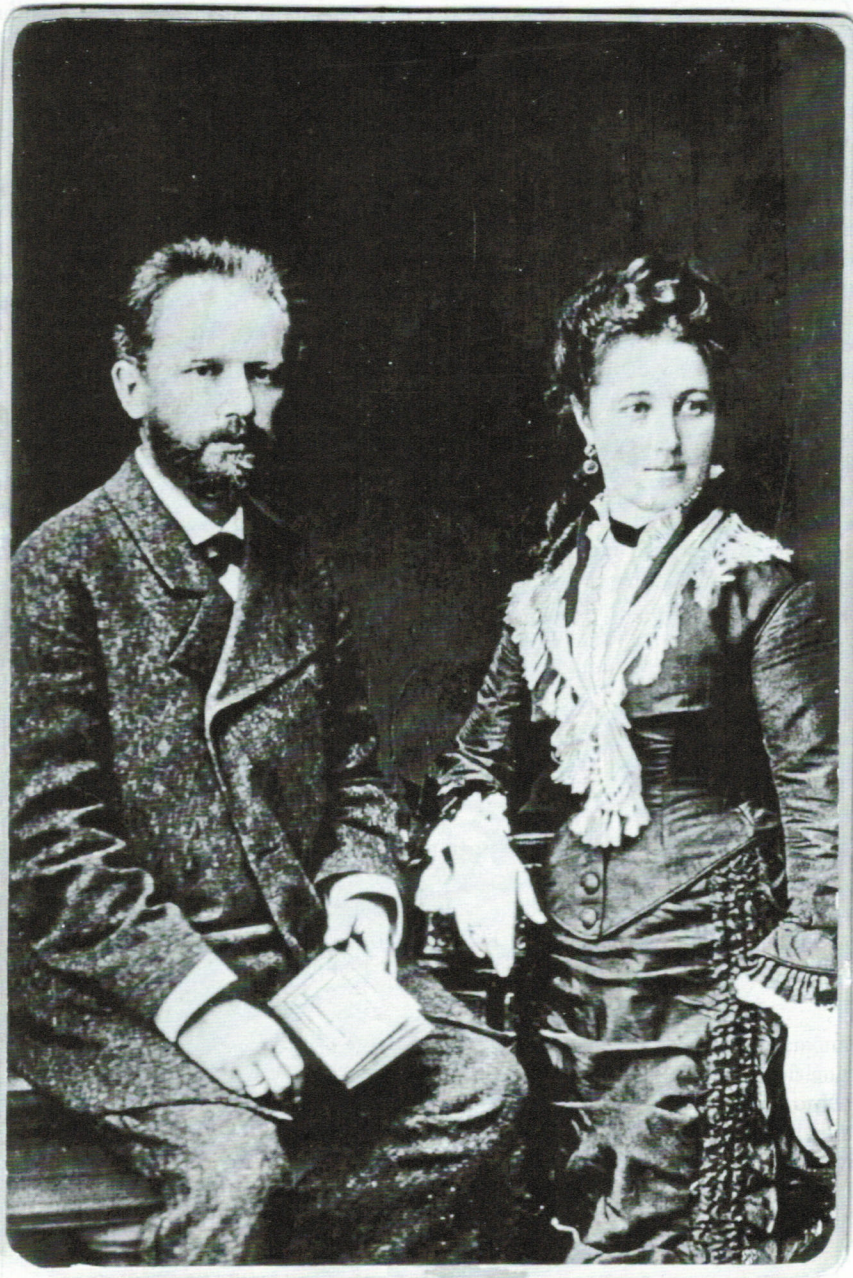
Abbildung 3: Petr Čajkovskij und Antonina Čajkovskaja (1877).

Eine so 3), die Val aus den 18 nach außen ebenmäßige rechte Kör Distanz zu wie es im Weichheit u zu herausfo Čajkovskij nahezu auss zu einer sch