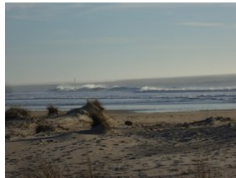
Strand San Fernando