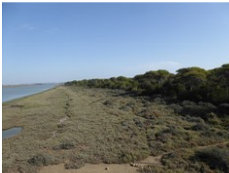
Parque Los Toruños

In Cádiz gibt es natürlich auch kulturelle und Freizeit-Angebote und die Möglichkeit sich mit Freunden an einem der Strände zu treffen.