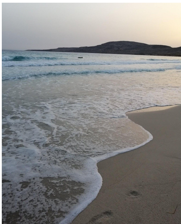
Blaues Wasser und sogar eine Schildkröte