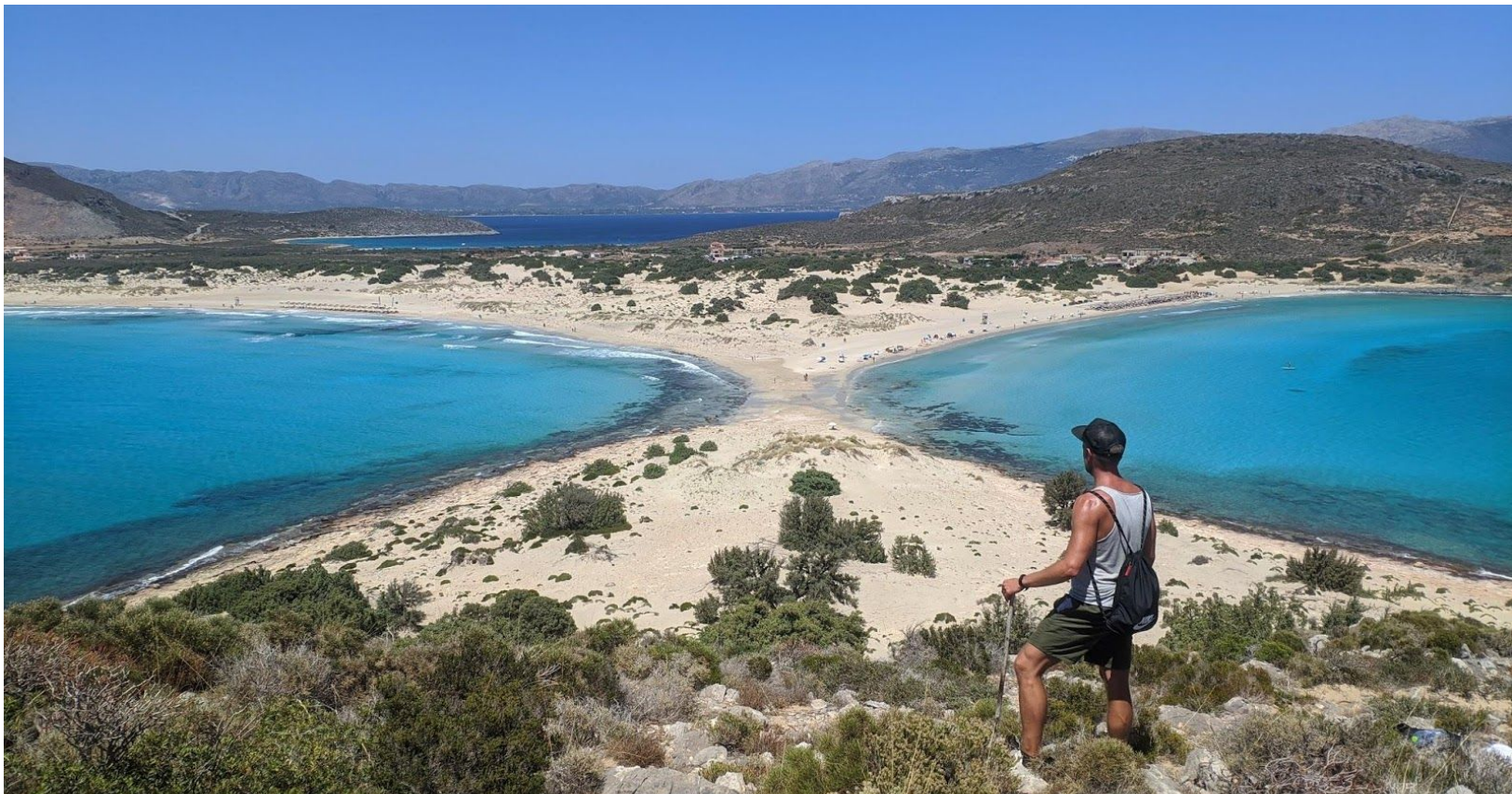
Simos Beach auf der Insel Elafonisos