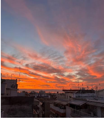
Sicht von der Dachterrasse unserer WG

etwas los, es ist nachts aber auch etwas lauter. Von der Idee sich erst bei seiner Ankunft in Thessaloniki um eine Wohnung zu kümmern ist unbedingt abzuraten.