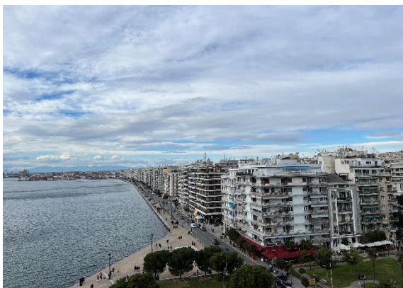
Sicht auf Thessaloniki vom Weißen Turm

Ende September 2022 flog ich endlich nach Thessaloniki. Den Flug hatte ich schon im Juni gebucht. Ich würde dazu anraten, 1-2 Wochen vor Semesterbeginn bereits in Thessaloniki zu sein, um an Events des Erasmus Student Network (ESN) teilzunehmen und alles Organisatorische zu klären. Mögliche Besuche in Deutschland (z.B. zu Weihnachten) sollten auch so früh wie möglich gebucht werden. Außerdem reicht ein Gepäckstück für den Hinflug (aber für den Rückflug vielleicht nicht mehr).