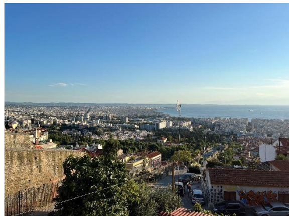
Blick auf Thessaloniki von der Upper City aus

Alle Kurse die ich gewählt hatte, wurden nur auf Griechisch angeboten. Das bedeutete, dass ich allen meinen Dozenten eine E-Mail geschrieben habe, in der ich meine Situation erläuterte und erfragte, wie meine Prüfungsleistung aussehen würden. Letztendlich schrieb ich in allen Modulen ein Essay; teils wurde mir das Thema vorgegeben, teils durfte ich mein Thema selbst wählen. Die Dozierenden waren dabei immer sehr