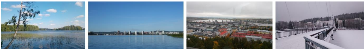
Der See neben dem Wohnheim, Blick auf die Stadt vom Jyväsjärvi und von Harju aus, Ambiotica (der Biologie Campus) im Schnee.

Jyväskylä ist ähnlich groß wie Oldenburg und ist was das Angebot an Geschäften, Museen (freitags jeweils kostenlos) und Co. angeht recht vergleichbar. Ebenfalls wird dort viel Fahrrad gefahren und ich fand es sehr praktisch mir für das Semester ein Rad geliehen zu haben. Nur gibt es deutlich mehr Steigung als in Oldenburg. Den ersten Schnee gab es Anfang November und Mitte Dezember waren es noch 5h Tageslicht. Ich bin damit aber ziemlich gut klargekommen.