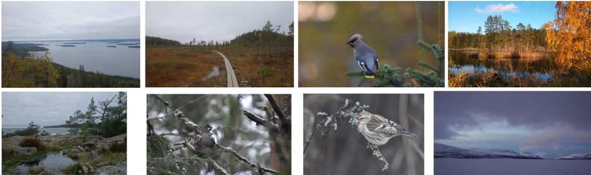
Der Koli Nationalpark, der Pyhä-Häkki Nationalpark, ein Seidenschwanz, der Konnevesi Nationalpark, Åland, ein Haselhuhn, ein Birkenzeisig, Kilpisjärvi mit Blick nach Schweden und Norwegen.

unternommen, die sich spontan während der Pride-Week gebildet hat. Die Organisation JKL Seta bietet auch auf Englisch regelmäßig Treffen für queere Menschen an.