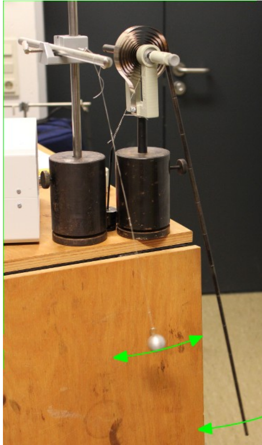
Abb. 2: Weiterer Aufbau, hier ein massebehafteter Stab.