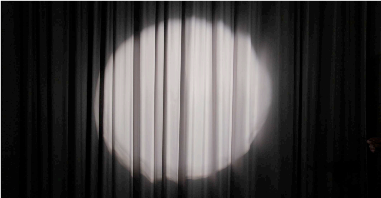
_ Videostill _ figures of speech 2012